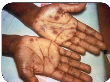
Сифилитическая сыпь на ладонях рук на вторичном периоде

Во время первичной стадии сифилиса Вы можете заметить единичную язву, но также могут появиться и множественные язвы. Язва — это то место, где вирус сифилиса проник в Ваше тело. Как правило, язвы твердые, круглые и не вызывают болезненных ощущений. Поскольку язва безболезненна, ее можно легко не заметить. После 3 - 6 недель язва заживает независимо от того, получили ли Вы лечение. Несмотря на то, что язва прошла, Вы все равно должны получать лечение, чтобы инфекция не перешла во вторичную стадию.