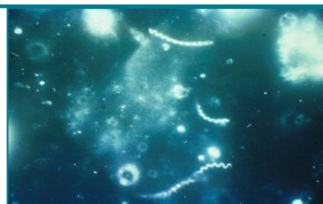
Темнопольное микрографическое изображение бледной спирохеты ( Treponema pallidum )

В большинстве случаев сифилис может быть обнаружен путем анализа крови. Некоторые врачи диагностируют сифилис путем исследования образца жидкости, взятой из сифилитической язвы.