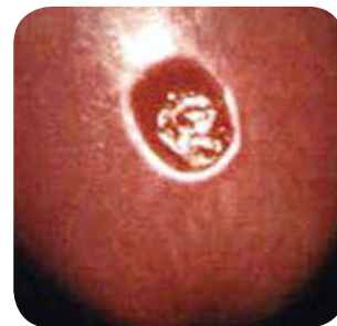
Изображение первичной сифилитической язвы.

Обмывание половых органов, мочеиспускание или спринцевание после секса не защитит Вас от сифилиса.